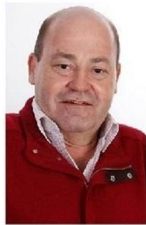
DIGITAL EDITION ©Toto García Noguera

TIENES MAS LECTURAS DE RELATOS BREVES, CUENTOS, MITOS Y LEYENDAS, AQUÍ: